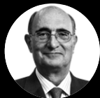
Julián García Vargas

Presidente del Consejo Docente de Talento-EPHOS. Exministro de Sanidad.