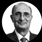
Julián García Vargas

Presidente del Consejo Docente de Talento-EPHOS. Exministro de Sanidad.