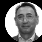
Javier Fernández de la Peña

Presidente Ejecutivo de Talento-EPHOS. Expresidente de Pfizer.