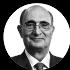
Julián García Vargas

Presidente del Consejo Docente de Talento-EPHOS. Exministro de Sanidad.