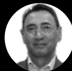
Javier Fernández de la Peña

Presidente Ejecutivo de Talento-EPHOS. Expresidente de Pfizer.